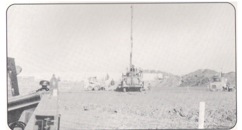
Site preparation and excavations.

"I dreamed of a home, sheltering our goals The charms of the Orient, aligned in its arcs Its hearth recalling to our souls Hills of Lebanon and Arab valour"